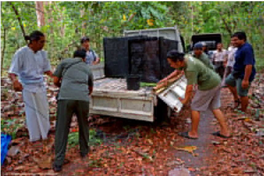
Proses pelepasliaran kelima merak Jawa di Taman Nasional Alas Purwo, Banyuwangi.

Dalam proses pelepasliaran yang dilakukan, tim FNPF sudah tiba di lokasi pelepasan di ujung timur Pulau Jawa, di wilayah Banyuwangi sejak pukul 5 pagi. Sebuah upacara Hindu dilakukan untuk memanjatkan doa kepada Tuhan untuk mendapat restu dan perlindungan sepenuhnya.